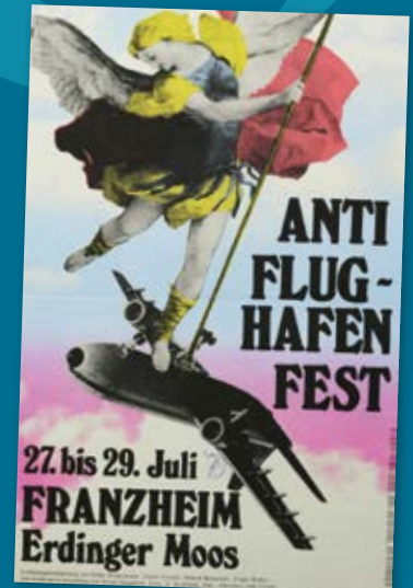
► WERBEPLAKAT FÜR DAS „ANTIFLUGHAFENFEST“ 1979, EINE PROTESTKUNDGEBUNG IM BEREITS VERLASSENEN ORT FRANZHEIM Franz Leutner, 1979; Gemeindearchiv Oberding. (Digitalbild: HdBG)

WÄHREND DIE EINEN ÜBER DEN FORTSCHRITT JUBELN, KLAGEN ANDERE ÜBER DIE NATURZERSTÖRUNG. VIELES IST HEUTE NICHT MEHR WEGZUDENKEN.